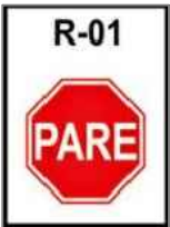
Sinalização Vertical, R-1 "PARE"