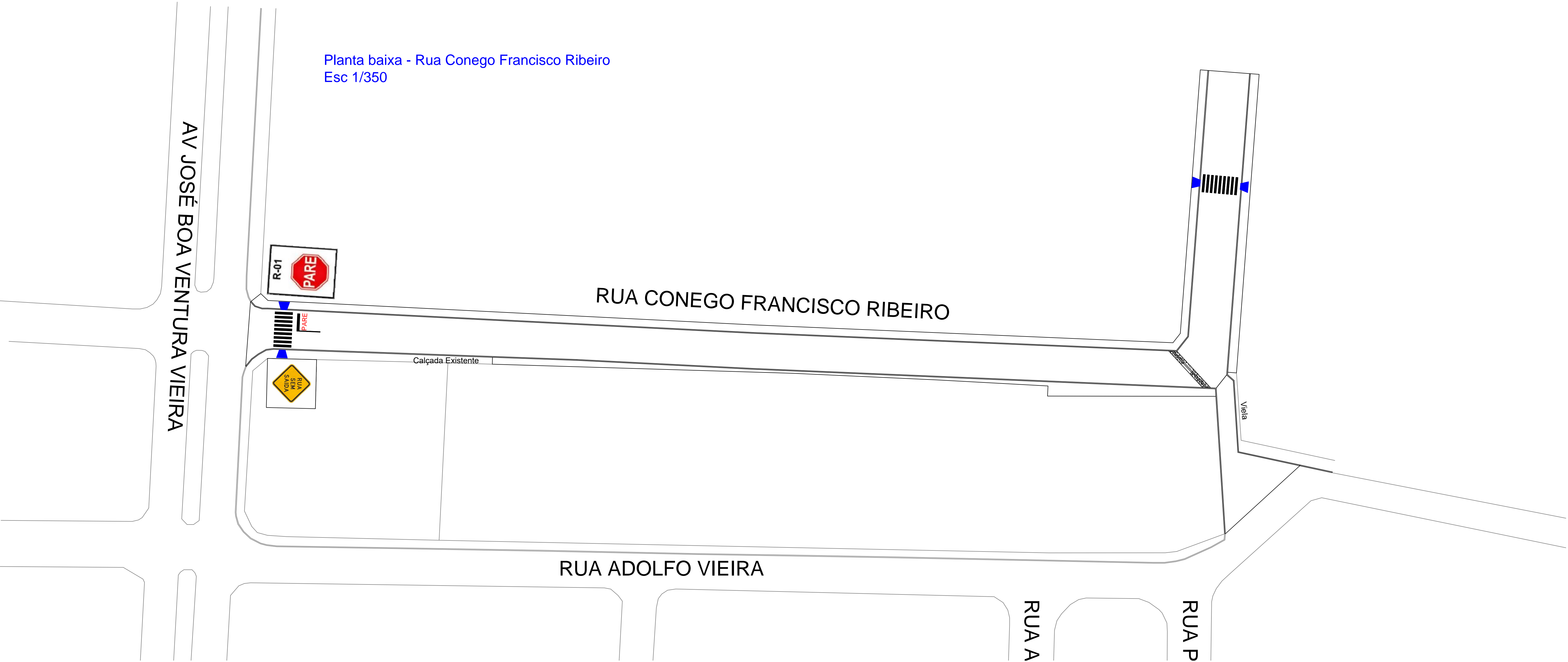
Planta baixa - Rua Conego Francisco Ribeiro Esc 1/350