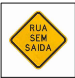
Sinalização Vertical, A-45 "Rua sem saída"